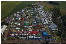
Show Rural Coopavel Cascavel - PR