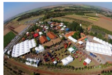
Feacoop Coopercitrus Bebedouro - SP