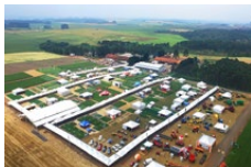
Wintershow Agrária Guarapuava - PR