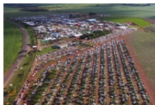
Tecnoshow Comigo Rio Verde - GO