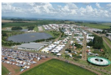
Expodireto Cotrijal Não-Me-Toque - RS