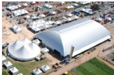
Agroleite Castrolanda Castro - PR