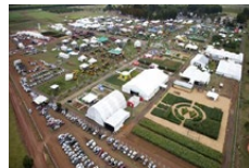
Agrobrásilia Brasília - DF